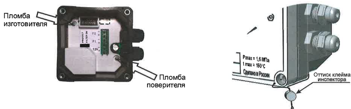
Рисунок 4 – Места пломбирования ЭБ исполнения 1

В целях предотвращения доступа к узлам регулировки и настройки, а также к элементам конструкции, предусмотрены места пломбирования, указанные на рисунках 4 и 5.